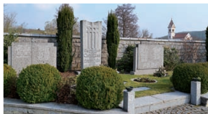
Das Ehrenmal am Friedhof in Unterauerbach – der ganze Stolz der SKK Auerbachtal.

dung wird nun am Sa., 10. August das 100-jährige Gründungsfest gefeiert.