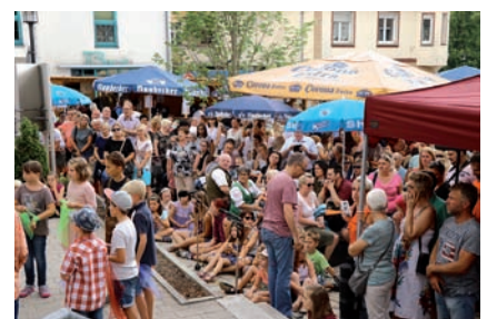
Impression vom letzten Bürgerfest

Das Geschehen konzentriert sich in der Ortsmitte auf vier Plätze mit Bühnen. Das ehemalige Brauerei-Gelände ist wieder fest in der Hand der Motorradfreunde und des 1. FC Schwarzenfeld. In der Schlossstraße befindet sich die obligatorische Bühne des Vereins Oischnak. Im Apothekerhof ist beim Bergchor St. Barbara ebenfalls Musik, Tanz und Gesang angesagt. Die vom Markt Schwarzenfeld betriebene Bühne am Platz am Kreuz bildet das Zentrum. Hier wird das Bürgerfest offiziell eröffnet und wie im letzten Jahr wird es eine Luftballon-Aktion geben. Diesmal sogar mit einem Luftballon-Weitflug-Wettbewerb!