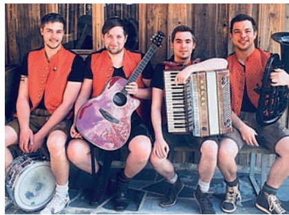
Die Jungs von Route 1234 sorgen am Samstag für Stimmung

Die KLB Schwarzach blickt nun stolz auf 50 Jahre zurück und wird dieses Jubiläum natürlich mit einem großen Fest feiern.