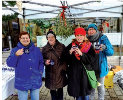
Teilnahme am Weihnachtsmarkt 2017

Vor Ort steht uns jeden ersten Dienstag im Monat ein Sachverständiger von der Kreisgeschäftsstelle Schwandorf ab 08.15 Uhr im Rathaus Schwarzenfeld zur Verfügung. Dieser Service kann ohne Termin von jedem Mitglied in Anspruch genommen werden, z. B. bei Problemen mit der gesetzlichen Rente, Arbeits- und Pflegeversicherung und anderen sozialrechtlichen Fragen. Ebenso wenn