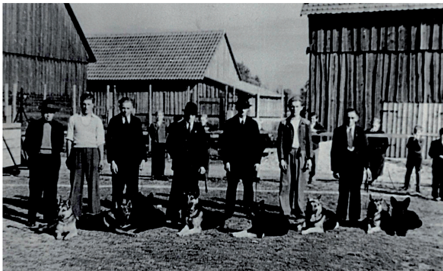
Ein Bild aus der Gründungszeit des Schäferhundevereins

Dies zeigt, dass die Ortsgruppe Schwarzenfeld seit jeher eine sehr aktive Ortsgruppe ist. Zusammenhalt und Kameradschaft sind hier wichtige Bestandteile, denn ohne