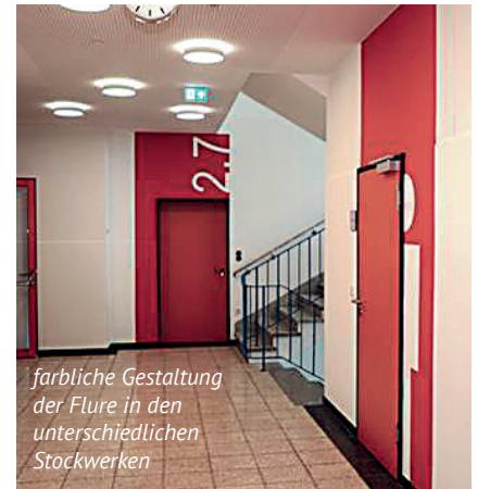
farbliche Gestaltung der Flure in den unterschiedlichen Stockwerken

Dank auch an Schulleitung, Lehrer, Hausmeister und Schüler die reichlich Beeinträchtigungen durch die Baumaßnahmen hinnehmen müssen.