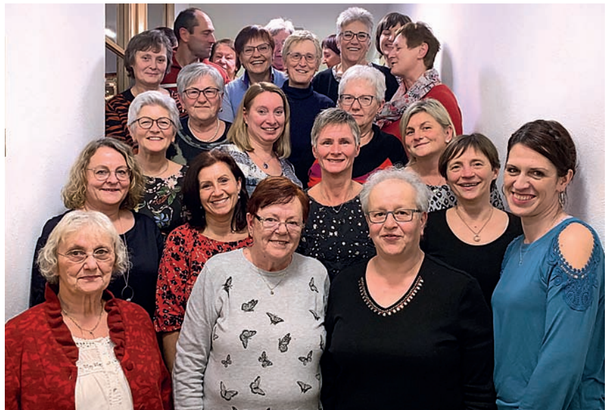
Ein Gruppenbild unseres gesamten Bücherei-Teams

Wichtig für unsere kleinen Leserinnen und Leser: Die Bücherei hat nun auch die beliebten Tonies im Bestand.