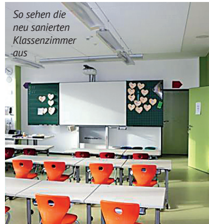
So sehen die neu sanierten Klassenzimmer aus

Die nachfolgenden Bilder vermitteln einen Eindruck wie hell, freundlich und farbig die Schule geworden ist. Die verschiedenen Stockwerke sind farblich unterschiedlich gestaltet. Daran angepasst die Farben von Boden und Belägen.